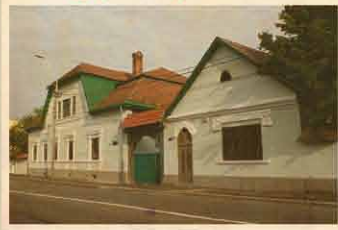
Nagybánya 2013. november 22.

Egy Küküllő menti magyar szórvány- központ