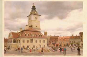
Barcaság 2014. február 28.

Két magyar falu a Fekete- Körös völgyében