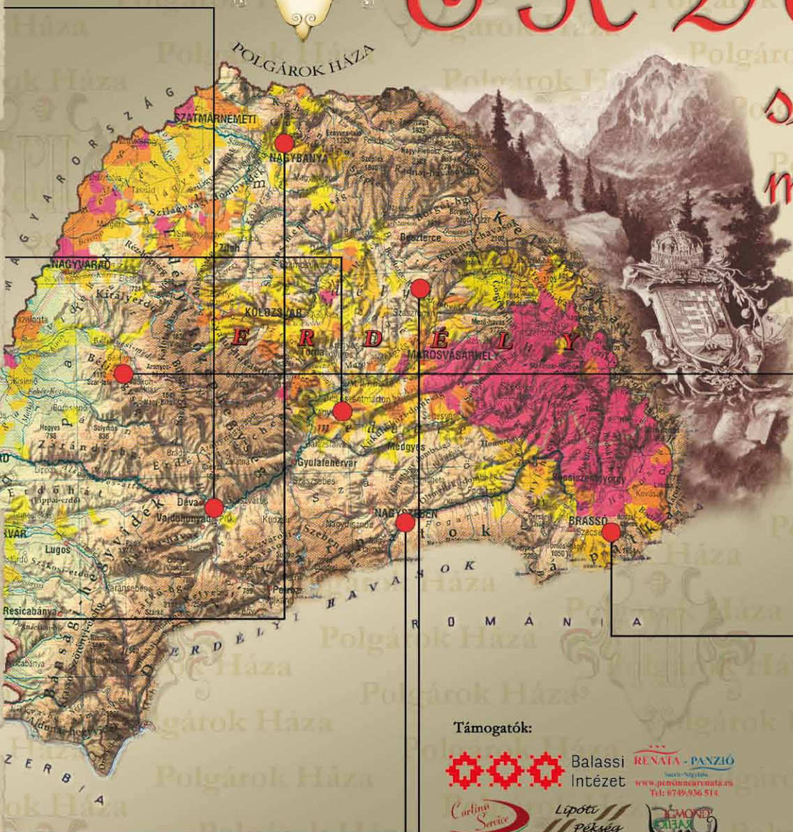
Várasfenes és Köröstarcsány 2014. január 31.