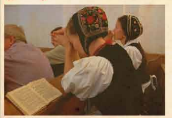
Zselyk 2013. december 13.