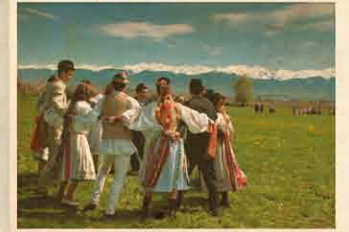
Oltozakadát 2014. március 28.

Egy Szeben megyei magyar szórvány- közösség