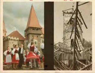
Hunyad megye 2013. szeptember 20.

Bukovinai székelyek, református magyarok