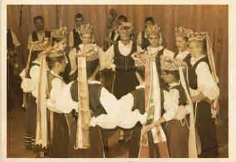
Magyarlapád 2013. október 25.

Egy Küküllő menti magyar szórvány- központ