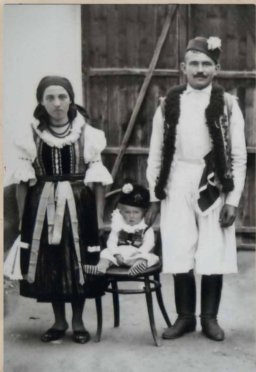
Köröstárkányi magyar család