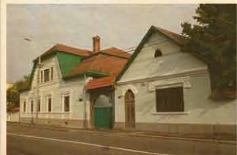
Nagybánya 2013. november 22.

Egy Küküllő menti magyar szórvány- központ