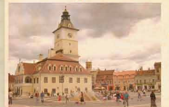
Barcaság 2014. február 28.

Két magyar falu a Fekete- Körös völgyében